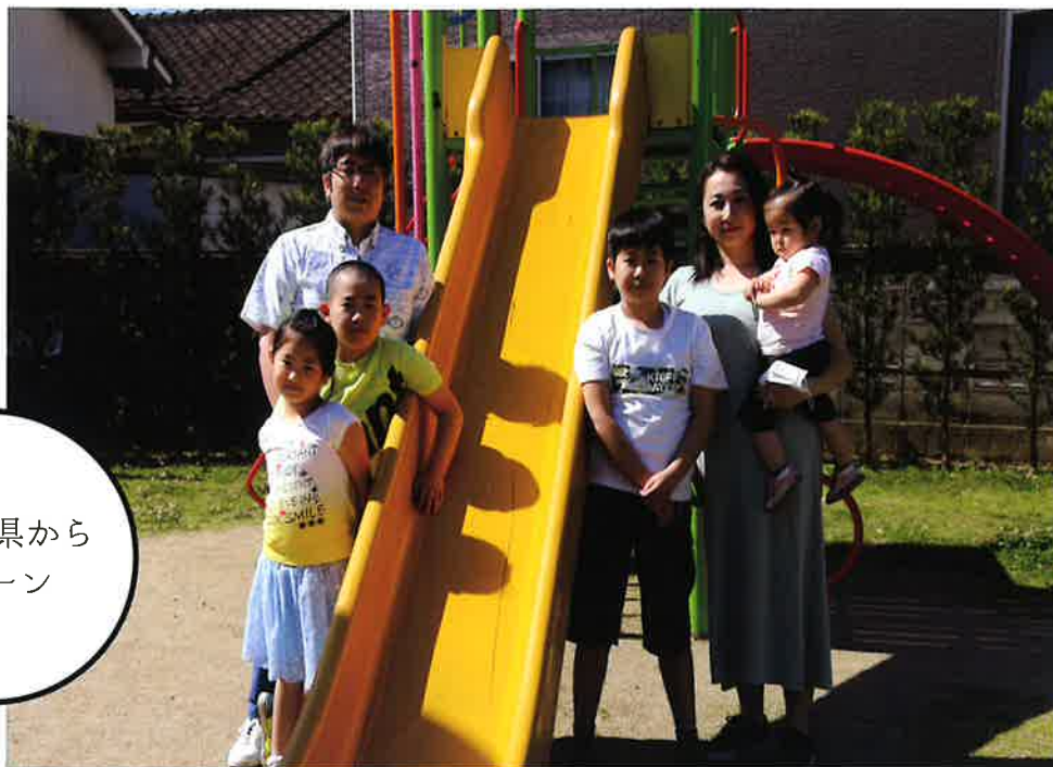
神奈川県から Iターン